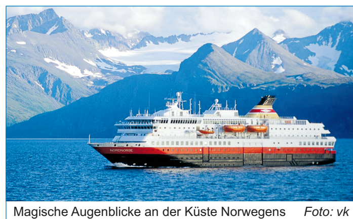
Magische Augenblicke an der Küste Norwegens

Der Dia- und Multivisionsvortrag am 23. März 2012 beginnt um 20 Uhr in der Kulturhalle Völklingen-Wehrden. Sie ist legendär, die traditionelle Postschifflinie an der norwegischen Küste, denn sie gilt als „die schönste Seereise der Welt“. Die Hurtigrute steuert als öffentliches Verkehrsmittel bei jedem Wetter alle wichtigen Hafenstädte an der west- und nordnorwegischen Küste an. Jeden Tag verlässt ein Postschiff den Hafen von Bergen. Nach fünf Tagen erreicht die Hurtigrute dann Kirkenes an der Eismeerküste kurz vor der russischen Grenze. Dazwischen liegt eine phantastische Welt aus Bergen, Gletschern, Fjorden, kleinen Fischerdörfern und einer See voller Überraschungen. Hafenstädte wie Ålesund, Trondheim, Tromsø und Hammerfest bieten sich als Ausgangspunkte für ausgedehnte Abstecher ins Landesinnere an. Die Hurtigrute ist eine Kreuzfahrt für Indivi-